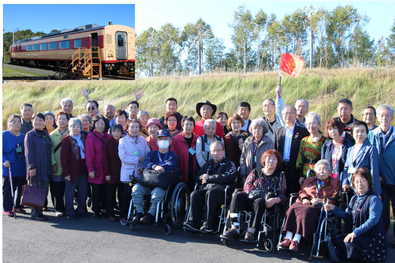
道の駅「あびら」にて