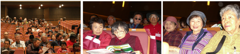
第68回全道身体障害者福祉大会登別大会風景