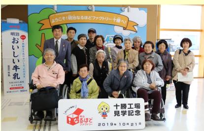
明治なるほどファクトリー

新得町にある「わかふじ寮」を訪問。母体である社会福祉法人厚生協会の創設の経過の説明を受ける。昭和28年5月に歩み始め現在に至る。新得町の人口6千人の5分の1余りが厚生協会に関わっている。フロアカーリングの製造過程を見学。1個1個が手作りで年70セット前後の売上げがある。1セット10万円。最も売れた年は千二百万円の売上。餅型用の木枠作りの最盛期で年内に1万セットを作る。また、居住空間も2人部屋が基本。共用空間もゆったりとしている。予定時間をオーバーし視察を終え、道の駅「しかおい」経由で帯広に戻る。参加された会員の皆様お疲れ様でした。