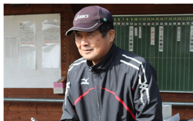
スポーツ部会長挨拶