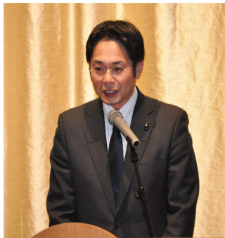
北海道議会議員 清水拓也 様