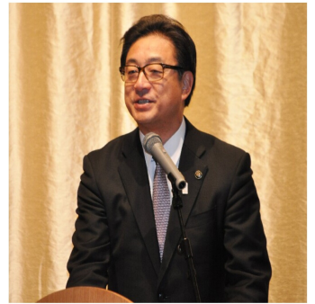
帯広市長 米沢則寿 様