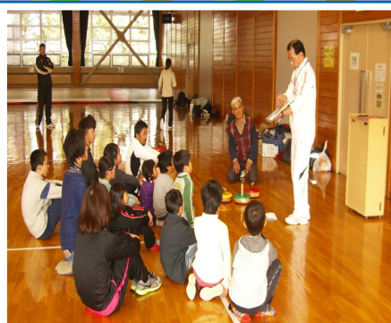
5名の会員の方が参加