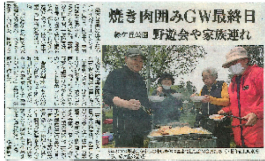
令和5年5月7日（日）掲載