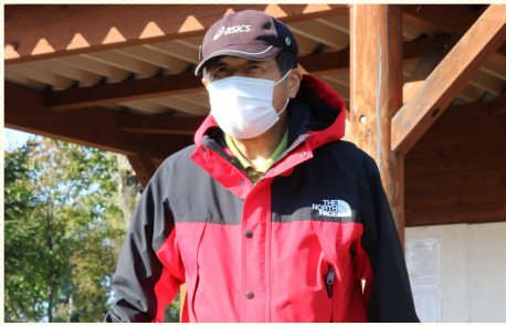
スポーツ部会長挨拶